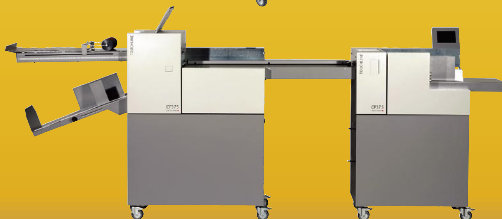
CP 375 associée à une TCF 375 par l'intermédiaire d'un transfert pneumatique