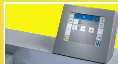
Ecran tactile couleur