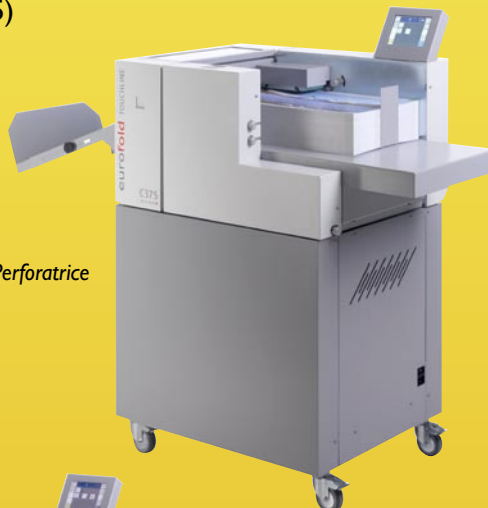
CP 375 Raineuse-Perforatrice

elle peut exécuter des travaux encore plus complexes.