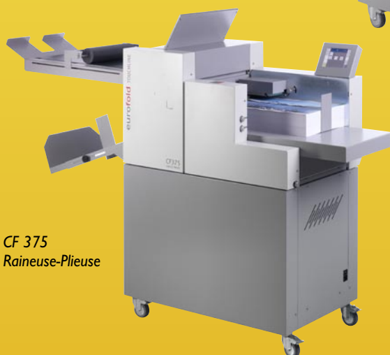
CF 375 Raineuse-Plieuse