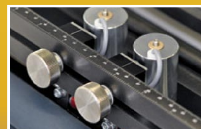
Tête de perfo sélective